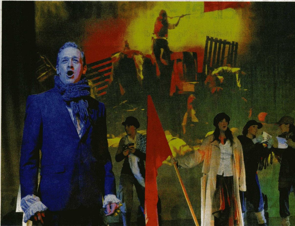
Auch Auszüge aus dem in Duisburg lange erfolgreichen Musical „Les Misérables“ werden beim Abend in der Rheinhausen-Halle erk

Zwei Wochen später reist bereits die nächste Musical-Gruppe an die Beethovenstraße. Das Laienensemble „Pro You“, das schon mehrmals mit seiner erfolgreichen Eigenpro-